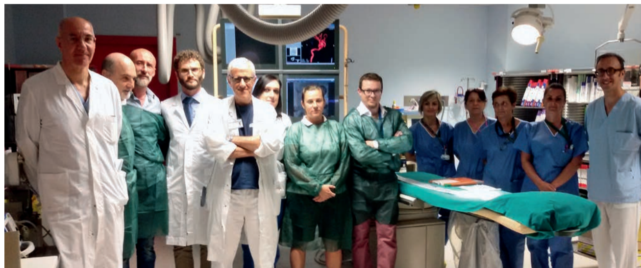
Il gruppo Neuro&CO

I primi incontri formativi accreditati ECM partiranno da settembre con cadenza mensile e verteranno su Anatomia e clinica nel paziente neurologico/neurochirurgico critico, casi clinici e un up to date della diagnosi e del trattamento dell'ipertensione endocranica.