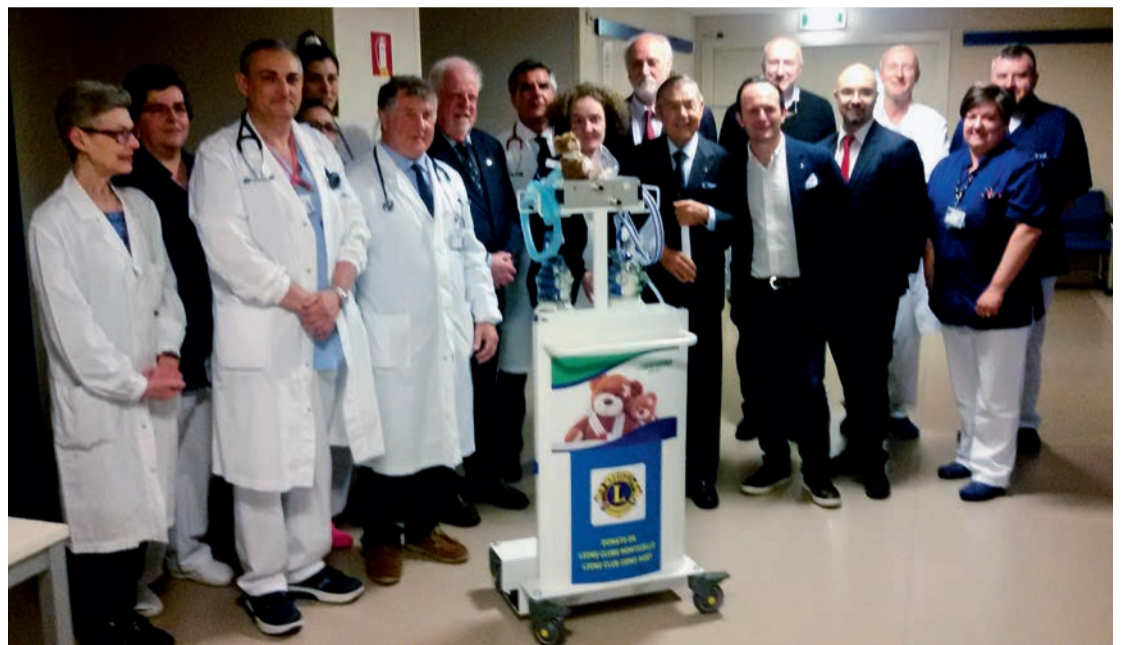
La consegna dell'apparecchiatura

Una componente rilevante del dolore da procedura nel bambino, inoltre, è la sofferenza prodotta dalla paura .