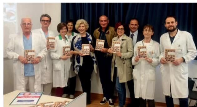
La presentazione del volume all'ospedale Sant'Anna

Il volume è stato stampato grazie al contributo dell'Associazione Nazionale Dentisti (Andi), compresa la sezione Como Lecco, da Geistlich Biomaterials e Megagen Italia e ha un prezzo di copertina di 15 euro . Il ricavato sarà destinato alla onlus "Tra Capo e Collo", costituita nel 2015 e impegnata nell'assistenza ai pazienti operati di tumori del distretto testa-collo. Per le informazioni sull'acquisto si può consultare il sito www.tracapocollo.com .