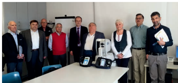
La consegna della donazione

Sul fronte delle tecnologie, il retinografo ricevuto in regalo è in funzione dai primi di maggio. Si utilizza per analizzare il fondo oculare e la retina, la membrana nervosa dell'occhio dove si formano le immagini che vediamo, che può essere danneggiata dalla malattia. Il biotesiometro serve per valutare la sensibilità vibratoria e consentirà di fare uno screening dei pazienti con neuropatia sensitiva. Il doppler, infine, è impiegato per studiare la circolazione degli arti inferiori.