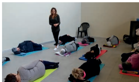
La lezione di pilates