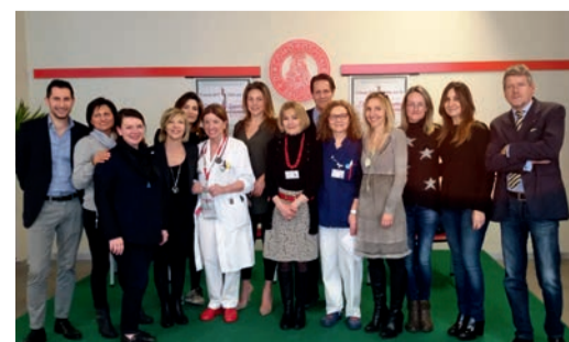
Organizzatori e ospiti