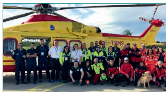
Il personale che ha accolto i visitatori e uno degli incontri in aula

La struttura accoglie anche la Guardia Medica e l'E-