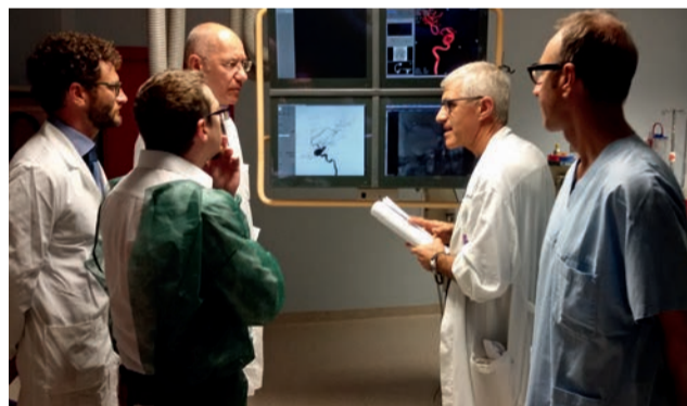
Un consulto tra specialisti